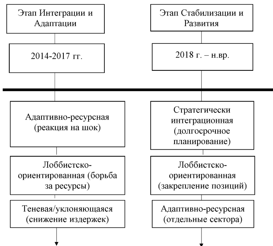
Рисунок 2 – Эволюция моделей экономического поведения хозяйствующих субъектов в Крыму (временная шкала)

Эта диаграмма рисунка 2 демонстрирует динамику изменения моделей поведения. В статье подчеркивается, что доминирование тех или иных моделей не статично.