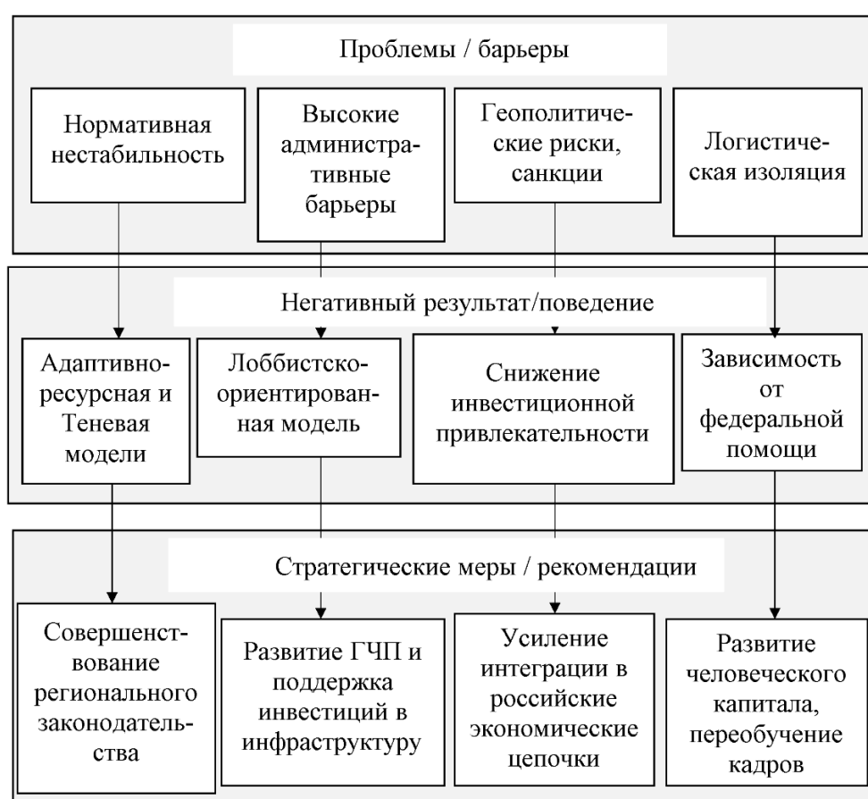
Рисунок 3 – Взаимосвязь «Проблемы - Результат - Стратегические меры»