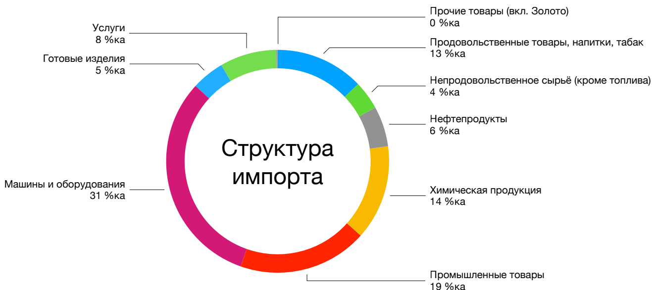
Рисунок 2 - Диаграмма товаров, импортированных в Узбекистан в январе – декабре 2022 года по видам продукции (в процентном выражении)

При структурном анализе влияния обменного курса на базовую инфляцию самая высокая доля приходится на продукты питания, достигнув 0,42%. Колебания курса непродовольственных товаров и оказания услуг влияние на инфляцию было относительно низким 0,18 и 0,16 процента соответственно.