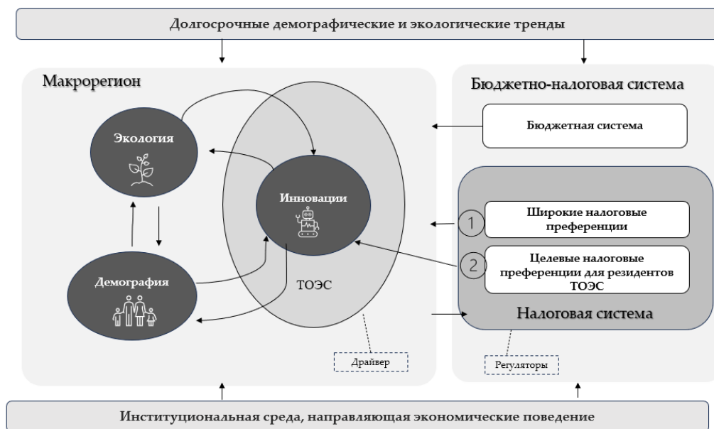
Рисунок 2 – Структурно-логическая схема концепции налогового стимулирования устойчивого регионального развития территорий с особым экономическим статусом

- режим пространственно-селективного стимулирования, ориентированный на создание локализованных точек роста. Реализация данного режима осуществляется через предоставление целевых налоговых льгот резидентам ТОЭС с перспективой последующего распространения генерируемых ими технологических и институциональных инноваций на всю территорию региона.