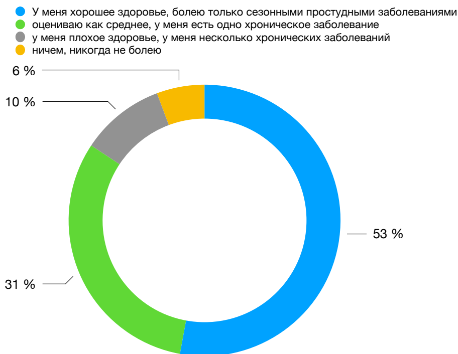
Рисунок 1 – Самооценка респондентами состояния здоровья (% от числа опрошенных)